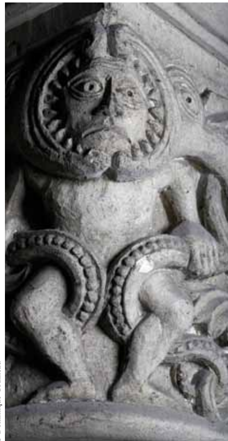
Chapiteau sculpté au rez-de-chaussée du clocher-porche

Haut de 25 mètres, le clocher porche était autrefois surmonté d'une flèche de pierre. Sa typologie est bien connue en Touraine mais également en Poitou et en Saintonge. Les modillons sculptés dans l'esprit roman placés à la base de la toiture ont été ajoutés au XIX e siècle. De même, le porche a été entièrement repris en sous-œuvre. Les motifs des chapiteaux sculptés s'inspirent du bestiaire médiéval. Dessinés au XIX e siècle par Gustave Guérin, ils sont installés à l'occasion de la restauration faite dans les années 1960.